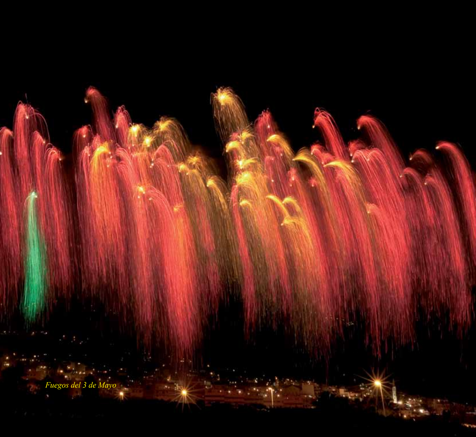
Fuegos del 3 de Mayo