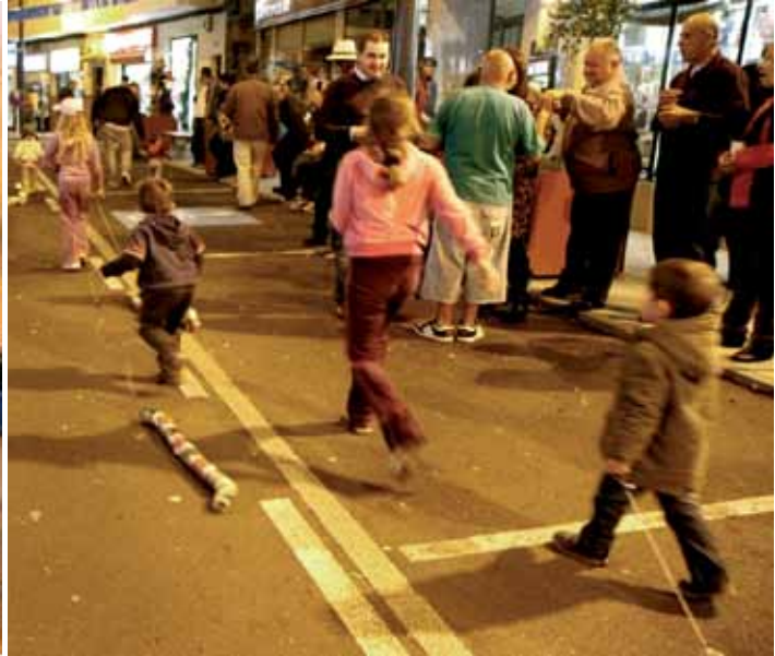
Arrastre de cacharros

es asemejar el ruido que hacían los toneles y barricas cuando los bajaban hasta al mar para limpiarlos. Ahora el recoger todos los utensilios inservibles y arrastrarlos en sana rivalidad de cuál es el cacharro mayor o el que más ruido hace es lo más habitual. Hace algunos años que grupos de vecinos o colectivos se reúnen para festejar a San Andrés con asaderos de castañas y comida canaria, como sucede en las inmediaciones del Círculo Viera y Clavijo.