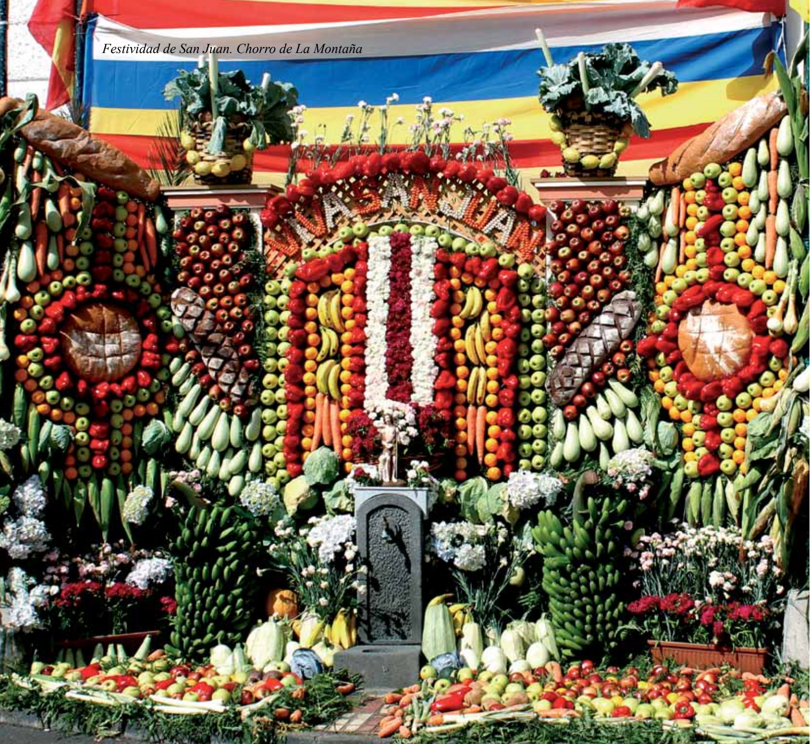
Festividad de San Juan. Chorro de La Montaña