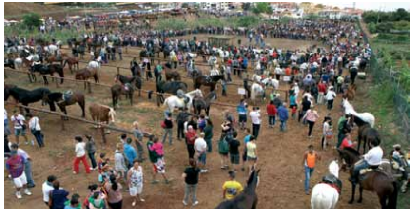
Feria de Ganado

Las fiestas de mayo de Los Realejos se pueden definir como una armoniosa composición de celebraciones festivas, de actos y actividades que durante todo el mes van conformando un variopinto programa, donde se rinde especial homenaje al acervo cultural de Canarias. El folclore, la devoción, la tradición y las señas de identidad nos definen el mes de mayo de Los Realejos.