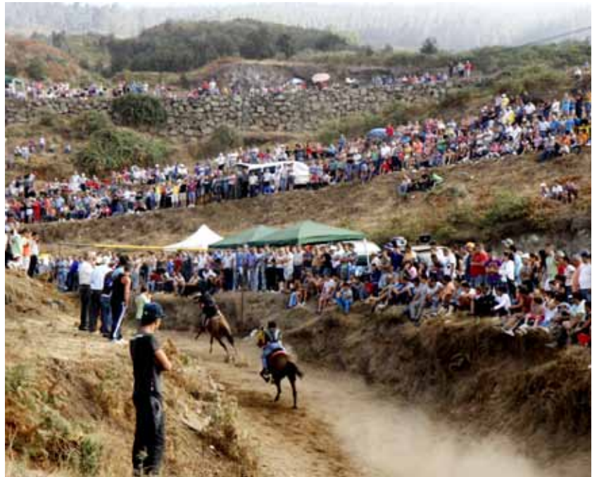
Carreras de Caballos. Cruz del Castaño

La devoción a la Santa Cruz se extiende por todos los rincones del municipio y prácticamente las fiestas en su honor se prolongan en todo el año, es el caso de la Cruz del Mocán, que tienen lugar en el primer fin de semana de septiembre. De lo que fue una sencilla fiesta familiar junto a la Cruz que había junto al camino, ha pasado a una destacada fiesta donde siempre ha primado