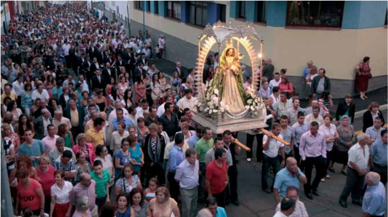
La Virgen del Buen Viaje está considerada la Candelaria del Norte