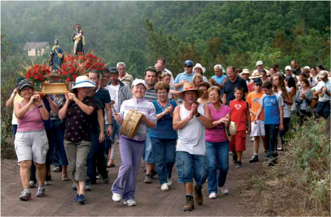
San Sigfrido se celebra en la zona recreativa de Chanajija