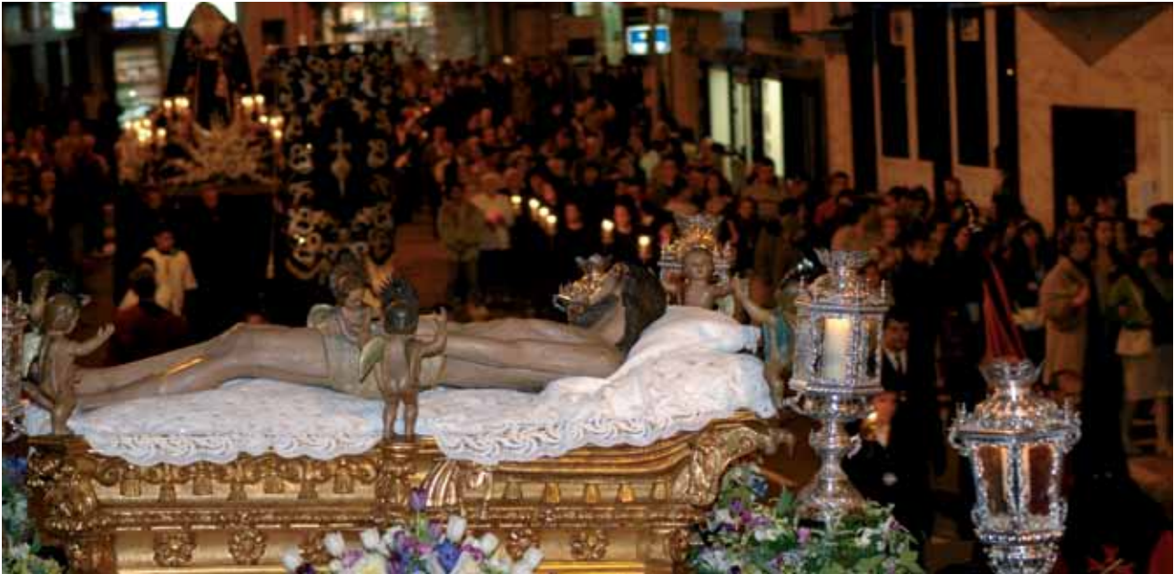
Procesión del Santo Entierro. Parroquia del Apóstol Santiago