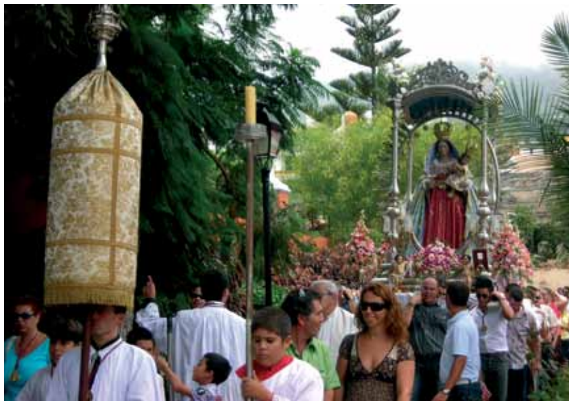
Ntra. Sra. de los Afligidos visita el cementerio de San Francisco

En el conjunto histórico del Realejo Bajo se celebran en el penúltimo fin de semana del mes de agosto las centenarias fiestas en honor a Nuestra Señora y Madre de los Afligidos. En la actualidad, los festejos populares están centrados en los festivales de variedades y el dedicado a los niños, bailes y la noche conocida como de los ventorillos. En el apartado religioso, los cultos se extienden desde el 15 de agosto hasta el lunes inmediato, donde la imagen sale nuevamente en procesión hasta el lugar que ocupaba el antiguo convento de Santa Lucía.