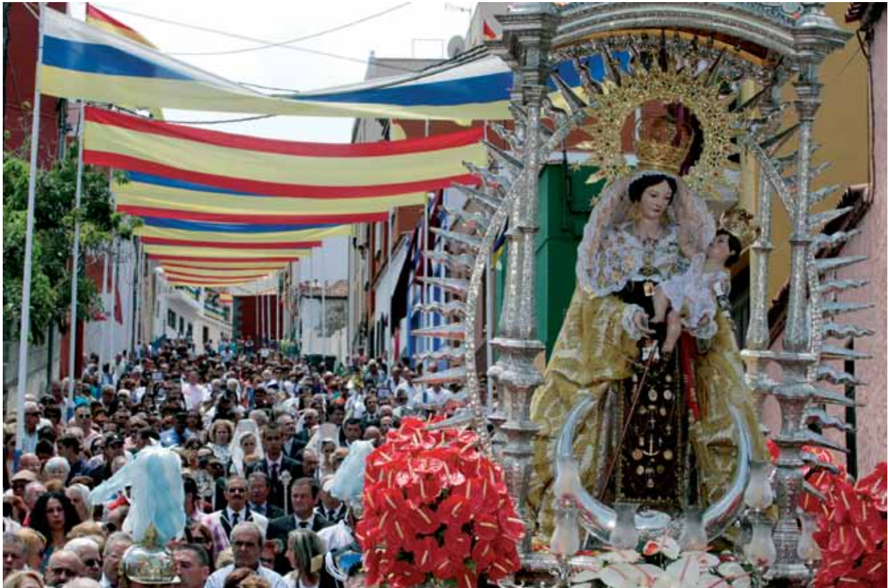
El lunes, la imagen recorre las Toscas de San Agustín y Puerto Franco

parada que realiza la procesión ante la llamada Cruz de las Toscas, actual calle García Estrada, además numerosas notas poéticas y musicales se dan a lo largo del recorrido, así como sueltas de palomas y lluvias de cohetes.