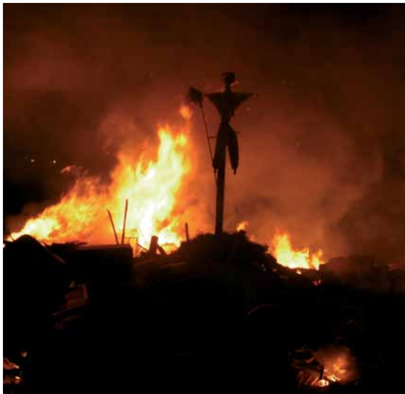
Las “fogaleras” son uno de los ritos de la festividad de San Juan

En la mágica noche del 23 de junio, víspera de la festividad de San Juan Bautista, tienen lugar las conocidas fogaleras , nombre que reciben las hogueras que arden con esa ritual tradición de quemar “las barbas al santo”. En ellas y durante varios días previos, niños y jóvenes se afanan en ir recogiendo enseres viejos y trastos, trozos de madera y hierba seca para montar las grandes piras que serán quemadas en la tarde y noche de ese día. Junto a ellas se concentran multitud de ritos, como saltar las brasas con cantos y dichos repetitivos, o simplemente turrar (asar) papas para comerlas entre los allí congregados. Pero las cos-