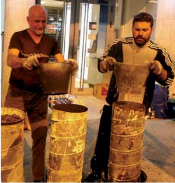
Castañas por San Andrés

es asemejar el ruido que hacían los toneles y barricas cuando los bajaban hasta al mar para limpiarlos. Ahora el recoger todos los utensilios inservibles y arrastrarlos en sana rivalidad de cuál es el cacharro mayor o el que más ruido hace es lo más habitual. Hace algunos años que grupos de vecinos o colectivos se reúnen para festejar a San Andrés con asaderos de castañas y comida canaria, como sucede en las inmediaciones del Círculo Viera y Clavijo.