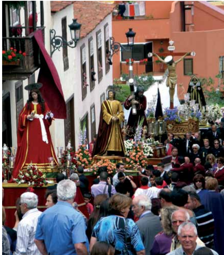
Procesión del Calvario. Parroquia de Ntra. Sra. de La Concepción

Con el comienzo de los actos desde el Viernes de Dolores, las diferentes funciones, cultos y procesiones van distribuyéndose a lo largo de los días santos,