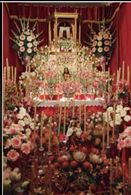
Víspera de la Santa Cruz en La Cruz Santa