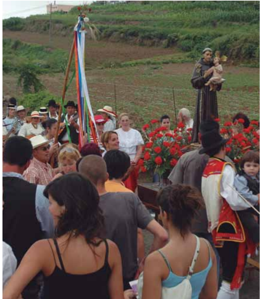
Romería de San Antonio. Icod el Alto

El Santo Madero sigue celebrándose durante este mes, y así nos encontramos con las fiestas de la Cruz de la Corona, que desde un privilegiado mirador domina todo el Valle de La Orotava. Una tradición que se remonta a 1923, cuando fue colocada la Cruz en promesa por haber salvado a unos cazadores de la muerte. A unos kilómetros más arriba de este