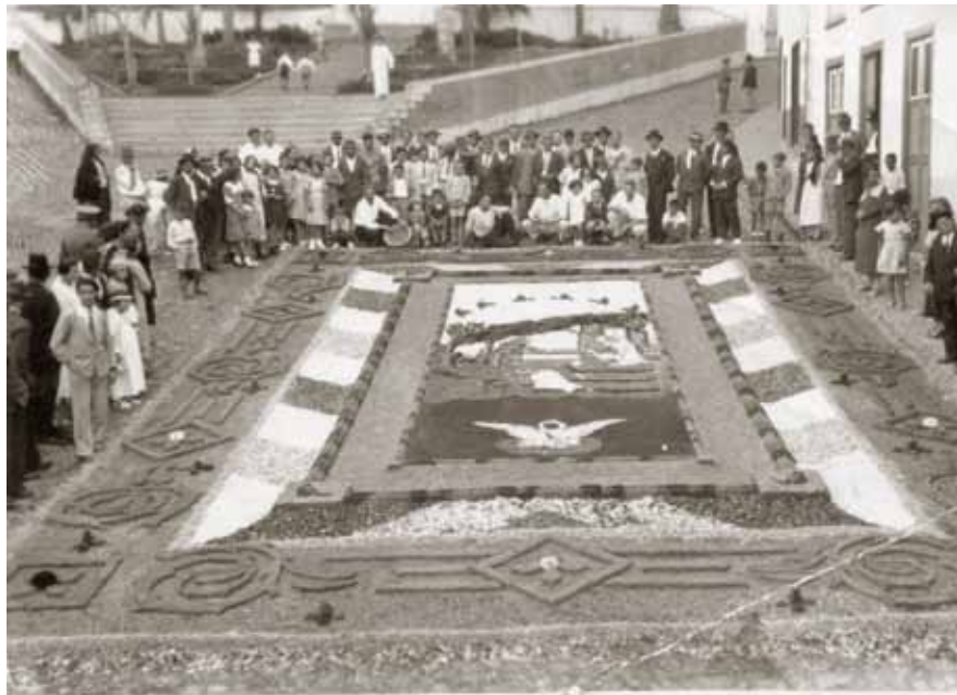
Festividad del Sagrado Corazón de Jesús. Realejo Bajo. 1933

La festividad cristiana del Cuerpo y de la Sangre de Cristo, conocida como Corpus Christi, se celebra en cada parroquia de la localidad con sus diferentes singularidades. Se tiene la costumbre desde muy antiguo de realizar tapices y alfombras por los recorridos procesionales, además de ornamentar las calles con ramos y colgaduras que penden desde ventanas y balcones, desde donde se tiran pétalos de flores al paso del Santísimo Sacramento. Es de destacar las alfombras de arena de la plaza de la Iglesia en el entorno del Realejo Bajo, y todos los corridos y cenefas que con base de brezo y flores se realizan por las calles del casco antiguo. También destacar las creaciones efímeras que se ejecutan por los vecinos de la Cruz Santa, sin desmerecer las realizadas en el Realejo Alto, La Montaña, Icod el Alto, o Toscal Longuera. En este último núcleo las celebraciones se adelantan al sábado anterior, destacando las alfombras realizadas con sal teñida de llamativos colores.