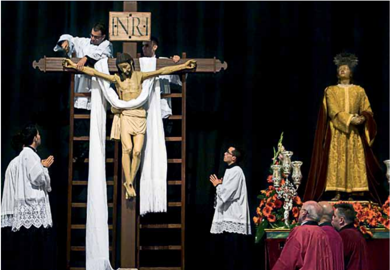
Ceremonia del Descendimiento. Parroquia de Nuestra Señora de la Concepción

ese tiempo con sobriedad, colocando grandes telones negros en los presbiterios, presididos por crucificados o la escena del Calvario. La realización de