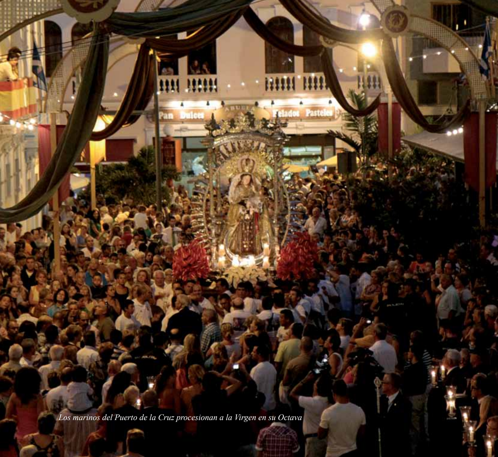
Los marinos del Puerto de la Cruz procesionan a la Virgen en su Octava