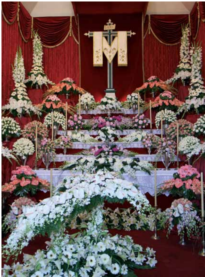
Capilla de Cruz de la Calle de El Medio