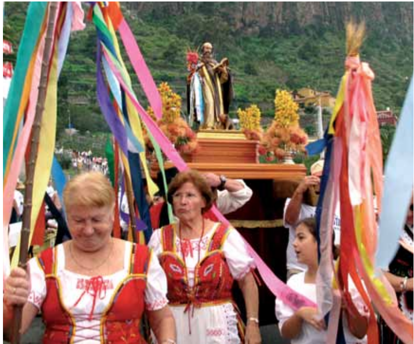
Romería de San Antonio en Tigaiga

Cobra una especial significación para los habitantes de Los Realejos, de ahí que tenga el título de compatrón de la localidad. La historia cuenta cómo a principios del siglo XVII una terrible peste bubónica asoló la costa del norte de la isla y los vecinos ante la calamidad rogaron a San Vicente su intersección, parando