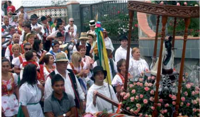
San Martín de Porres se festeja en el núcleo de Placeres y La Romera

Junto a su pequeña capilla los vecinos se congregan durante unos días, organizando diferentes actos populares, lúdicos, infantiles, religiosos y deportivos