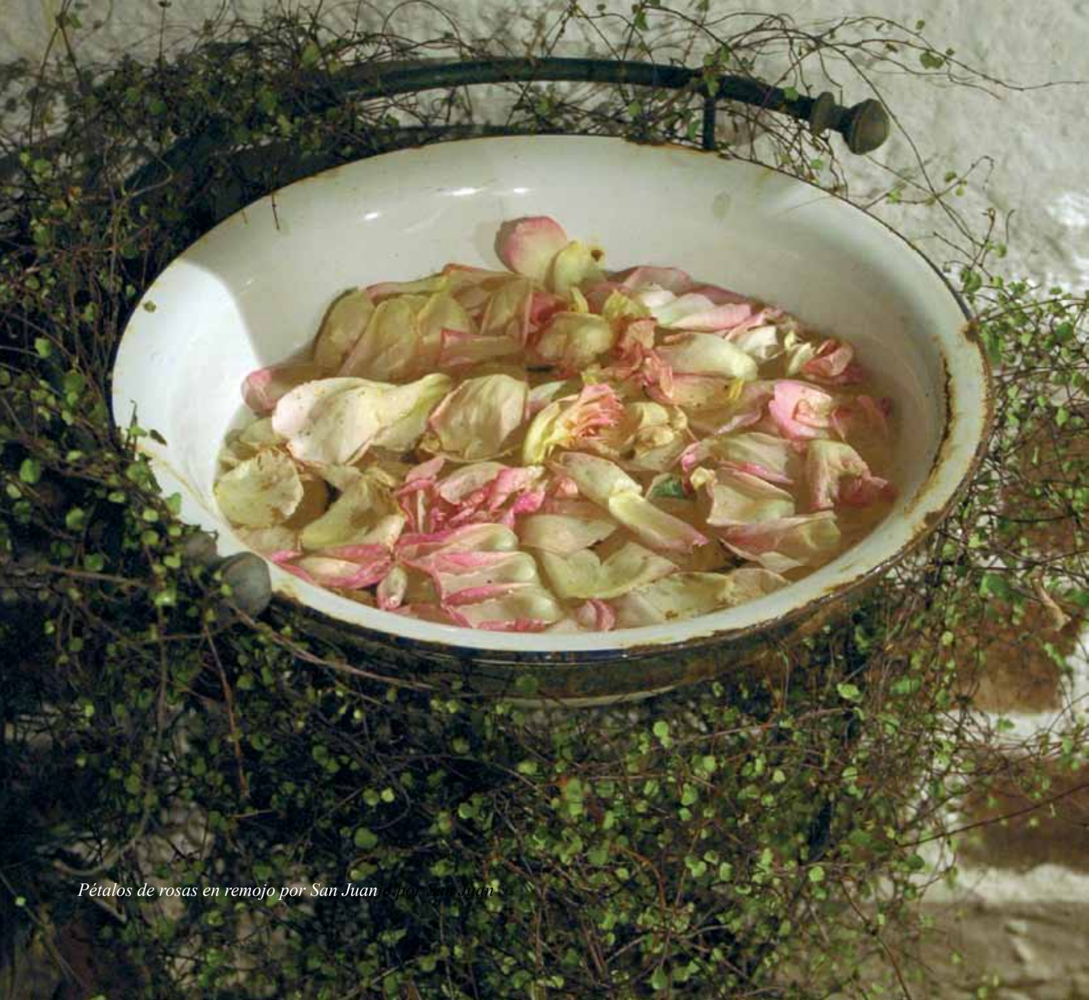
Pétalos de rosas en remojo por San Juan o por San Juan