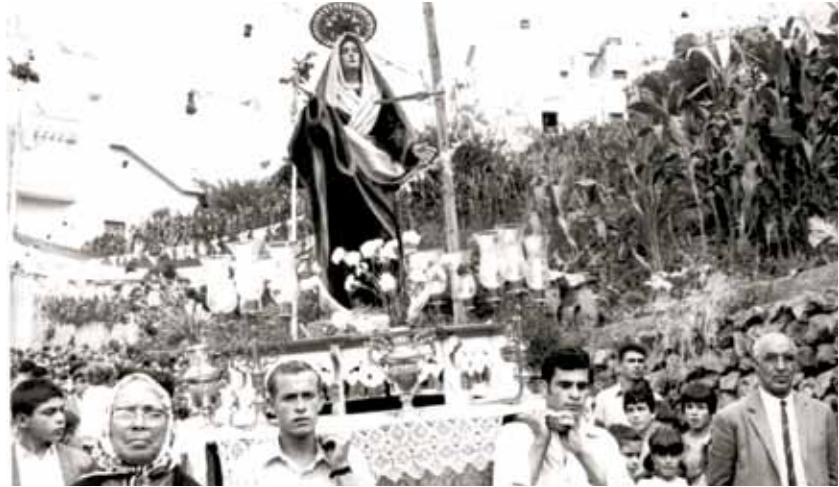
Virgen de los Dolores (Palo Blanco)

Julio termina con las fiestas del Carmen, pero no podemos olvi-