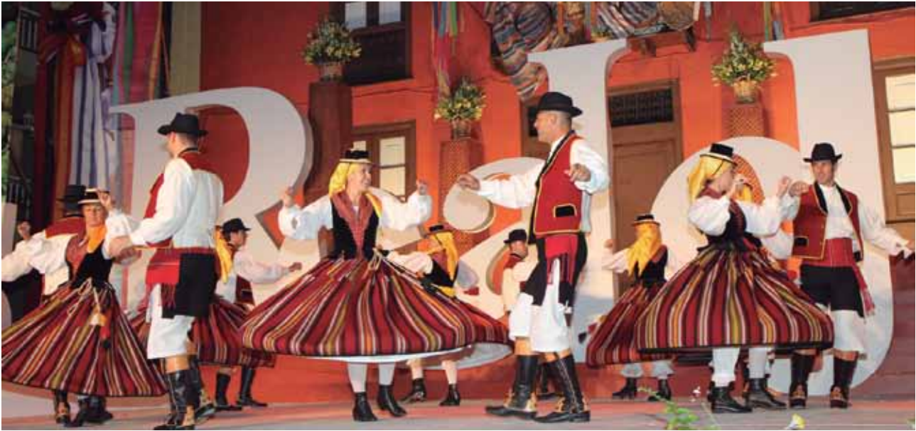
El folclore está muy presente en las Fiestas de Mayo