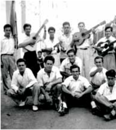
Parranda en San Benito

vecinales, sin olvidarnos de la función religiosa que concluye con la procesión recorriendo la zona.