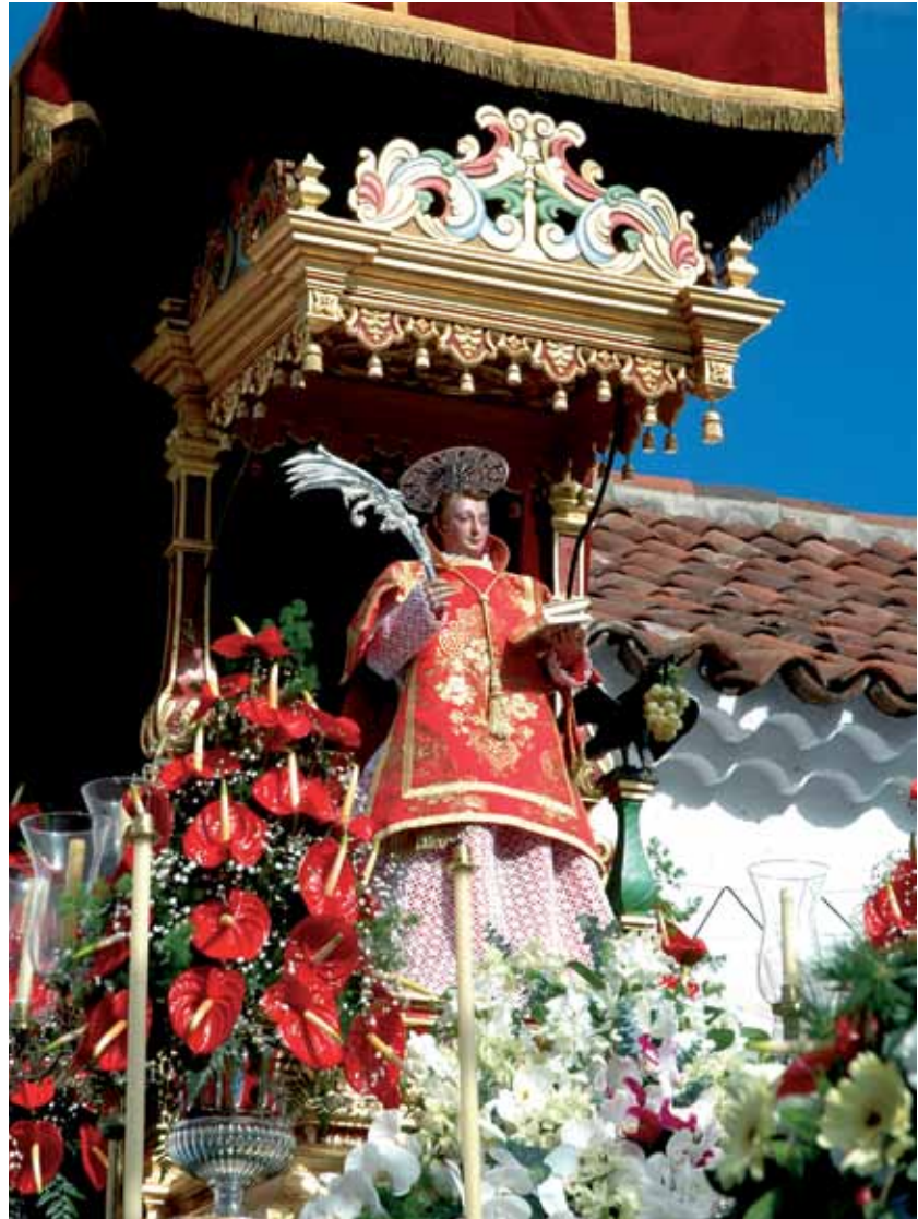
San Vicente Mártir, compatrón de Los Realejos

Junto a la Hacienda de Los Príncipes, dentro del casco histórico del Realejo Bajo, en los últimos días del mes de enero o primer fin de semana de febrero se celebran las fiestas en honor a San Sebastián. Las notas predominantes son los actos religiosos, actuaciones musicales y comidas de vecindad.