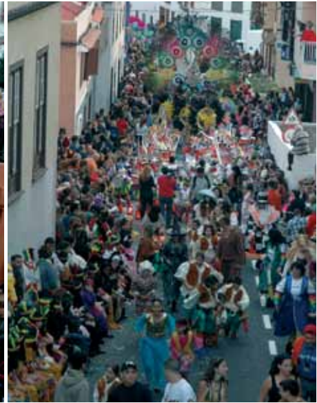
Una explosión de fantasía toma las calles del municipio

gar las galas de elección de las reinas, que nos dejan paso al coso infantil, que parte desde la plaza de La Carrera hasta la plaza de San Agustín. En el Carnaval participan todos los grupos de la localidad, y siempre gira en torno a un tema específico. El lunes se considera como el día más importante, con el coso apoteosis del carnaval realejero, que parte desde Tigaiga hasta San Agustín, participando infinidad de personas disfrazadas, coches engalanados, murgas, comparsas,