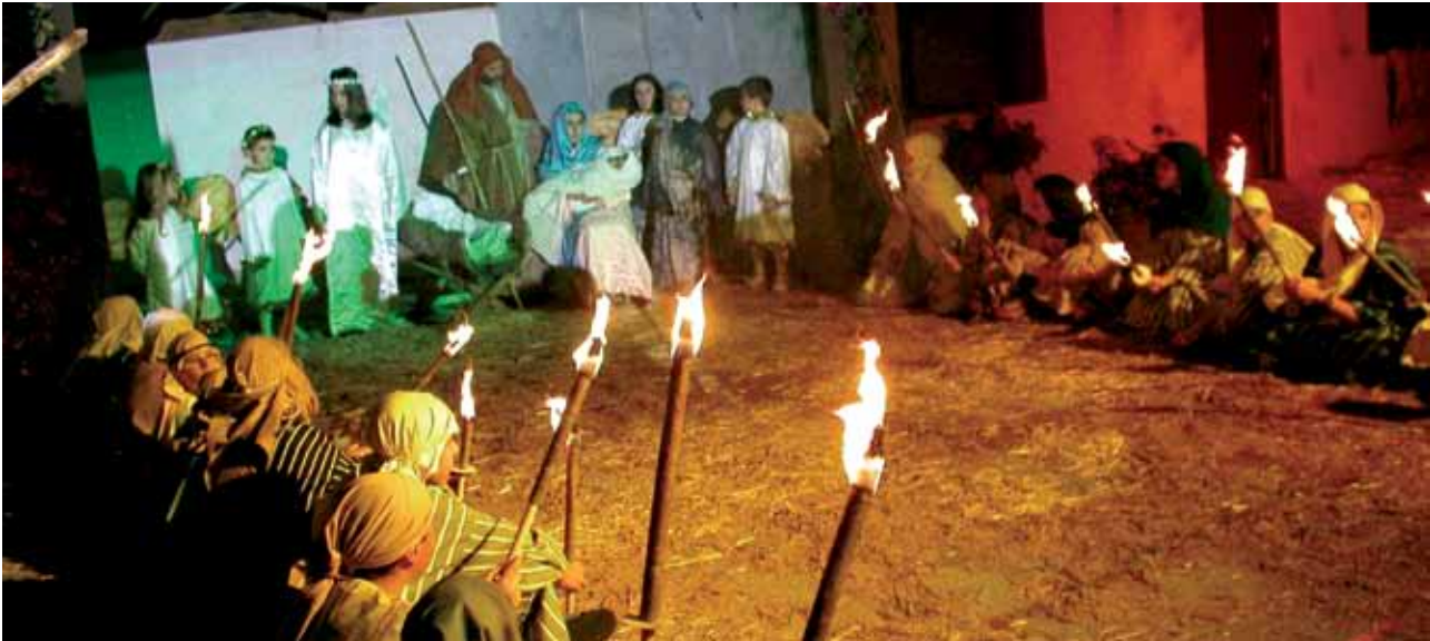
El Belén de Tiguaiga cuenta con más de 30 años de tradición