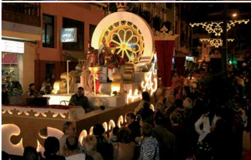
Multitudinaria cabalgata de Reyes