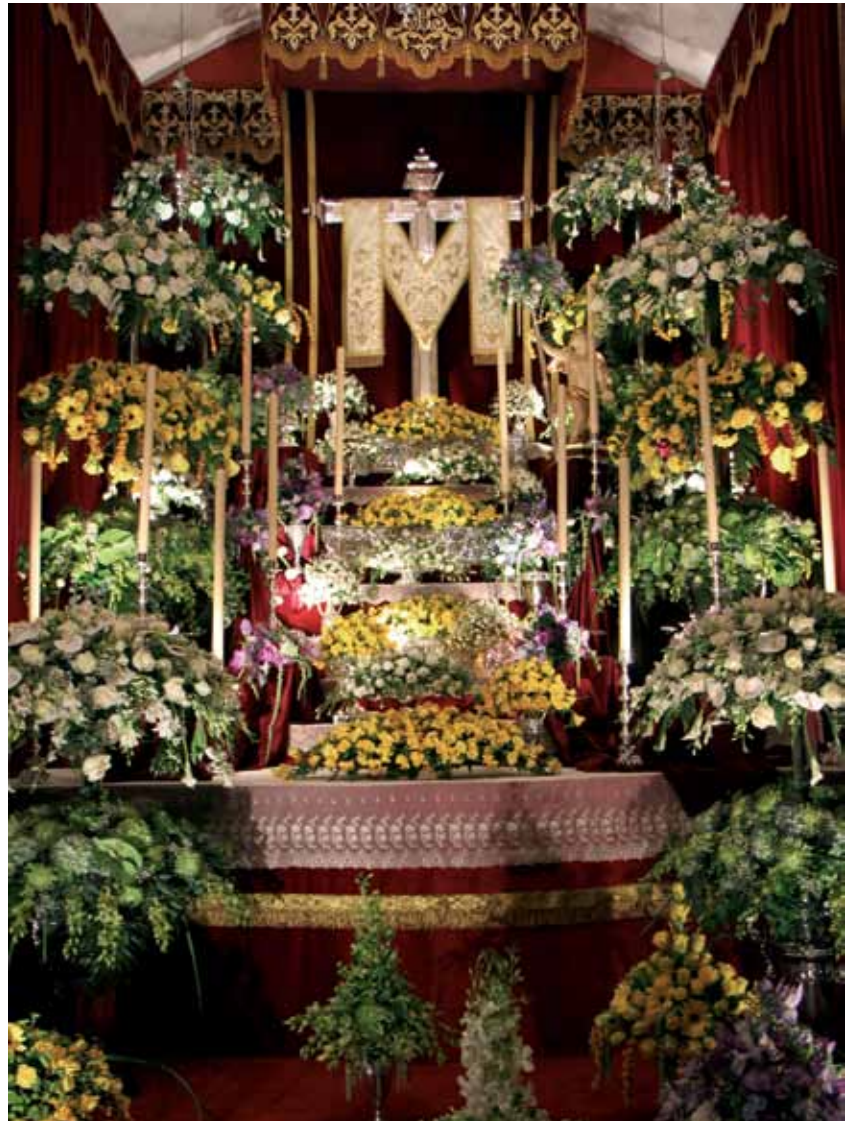
Capilla de Cruz de la Calle de El Sol

Punto y aparte merecen los fuegos en honor a la Santa Cruz. La historia comienza en el siglo XVIII, cuando los habitantes de la calle de El Sol, medianeros y agricultores, y los de la calle de El Medio, burgueses y aristócratas, rivalizaban por el mejor adorno de la Cruz de su calle. Un pique que en el siglo XX tomó especial significación con interminables lluvias de cohetes y voladores, hasta derivar en la exhibición de fuegos de artificio, considerada como la mayor de Canarias. Más de dos horas de continuo disparo de pólvora, convertida en armoniosos compases y recreaciones coloristas de luz que iluminan el cielo realejero. Son miles de personas las que se congregan para tan singular espectáculo que