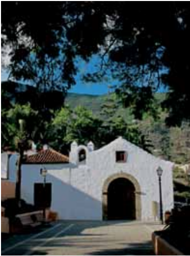
Ermita de San Sebastián

que se les tributa a los vecinos, donde no faltan las papas del país, los plátanos guisados o el pescado salado.