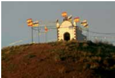
Cruz del Pico. La Montaña

El mes de mayo se inicia en Los Realejos con la celebración de la Invención de la Santa Cruz. El tres de mayo para los realejeros supone altares de flores, capillas adornadas, casas que se abren al visitante para contemplar su particular Santo Madero, pero también fuego y pólvora. Los festejos en honor a la Santa Cruz cobran especial protagonismo en la parroquia del Apóstol Santiago, incluyendo las calles de El Medio y El Sol, el núcleo de la Cruz Santa y en general en todo el municipio. En estos primeros días se celebran fiestas en determinadas zonas, como la Cruz del Peral, la Cruz de la Casa Higa, la Cruz del Pico de la Montaña del Fraile, la Cruz del Dornajo o la Cruz de la Carrera.