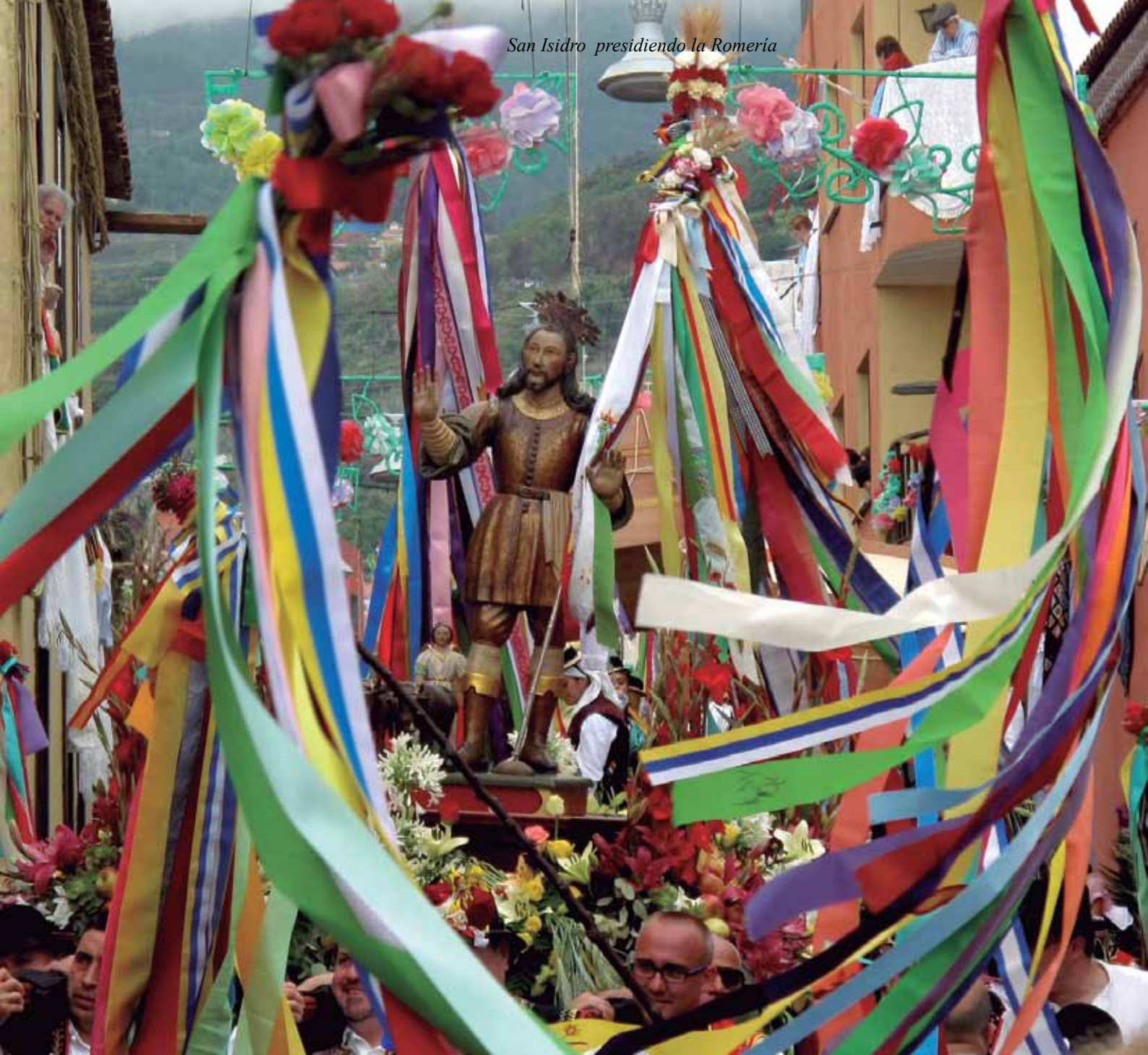
San Isidro presidiendo la Romeria