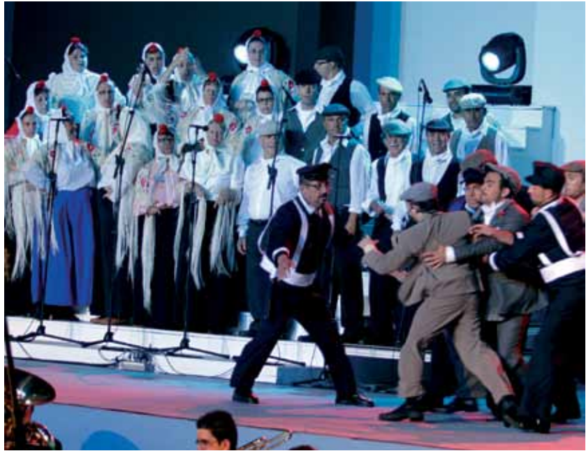
La Zarzuela ha tomado en los últimos años un especial protagonismo

El origen de la devoción a la Virgen del Carmen en Los Realejos