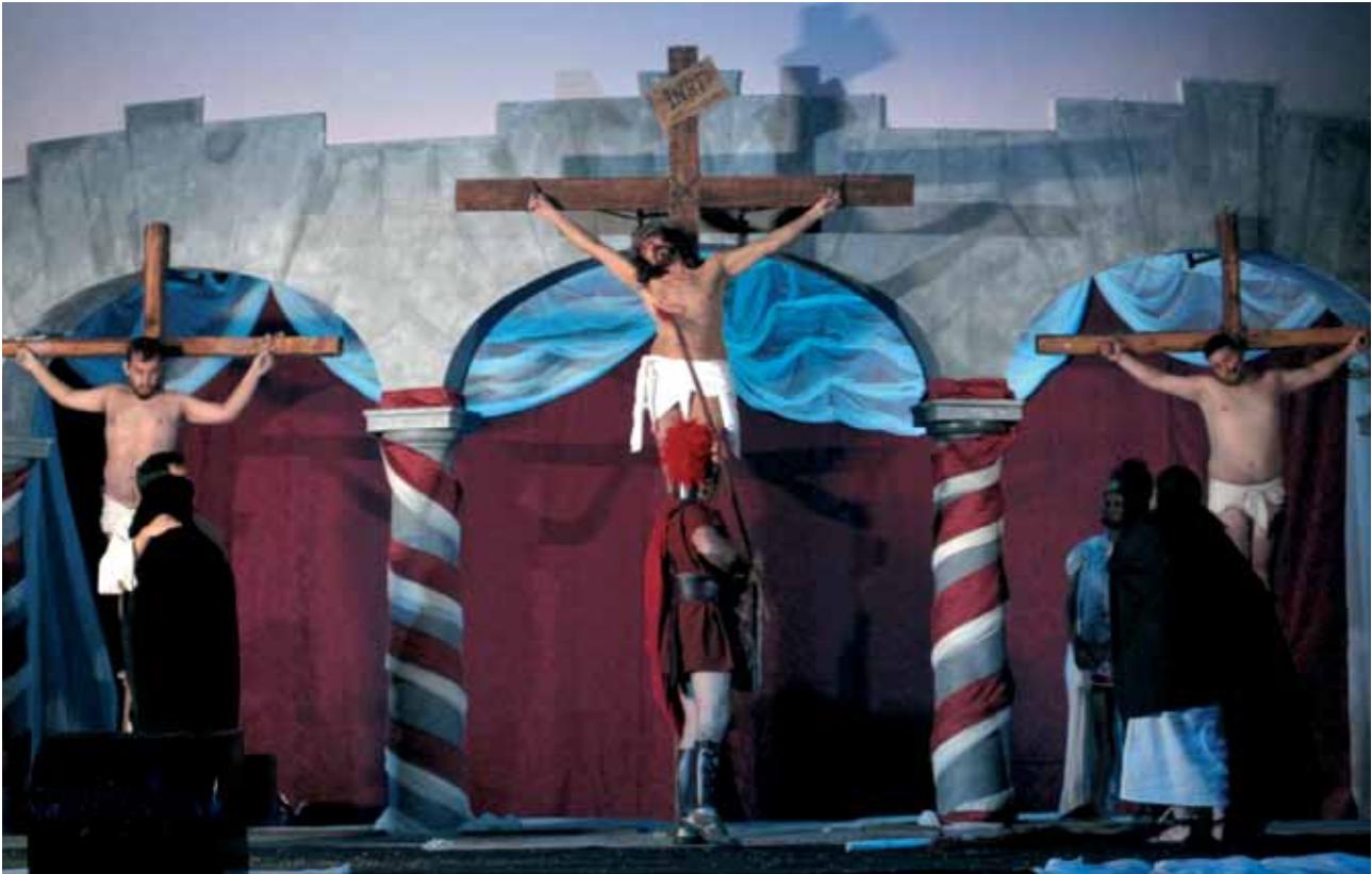
Representación de la Pasión. Parroquia de la Santa Cruz. La Cruz Santa