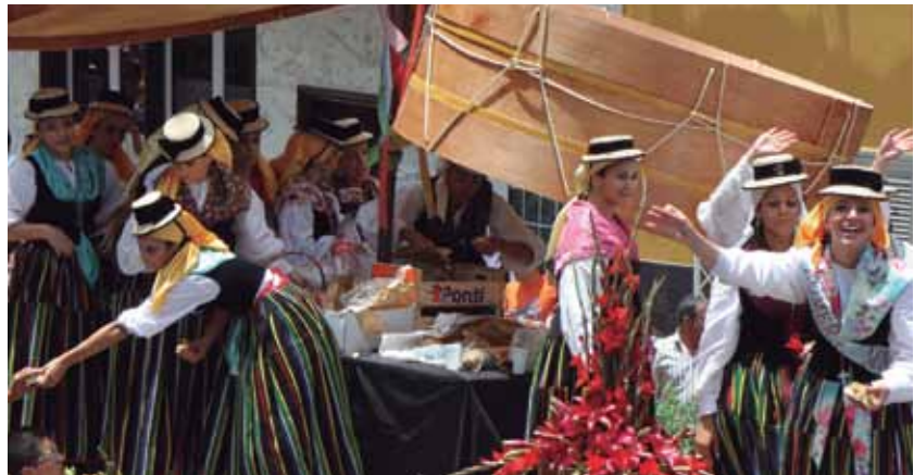
Romería Regional de San Isidro Labrador y Santa María de la Cabeza

y parroquianos se congregan en el templo para celebrar los oficios eucarísticos, y su posterior procesión por las calles del casco