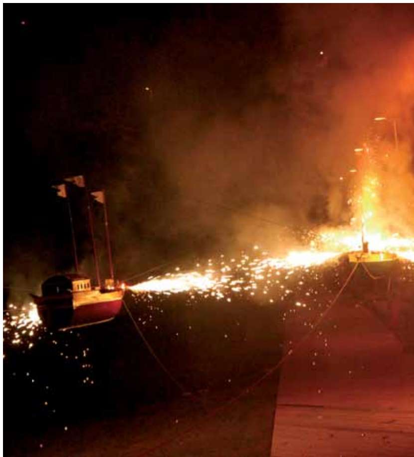
Fiestas de Rosario. Representación de la batalla de Lepanto

La festividad de Nuestra Señora del Rosario, el siete de octubre, inicia una serie de celebraciones religiosas en su honor, centradas en la parroquia de Nuestra Señora de la Concepción en el Realejo Bajo. La historia de esta