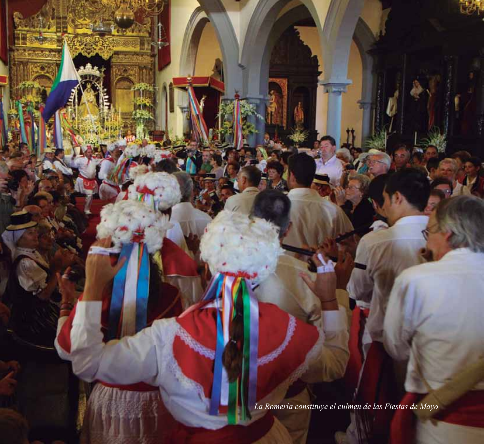
La Romería constituye el culmen de las Fiestas de Mayo