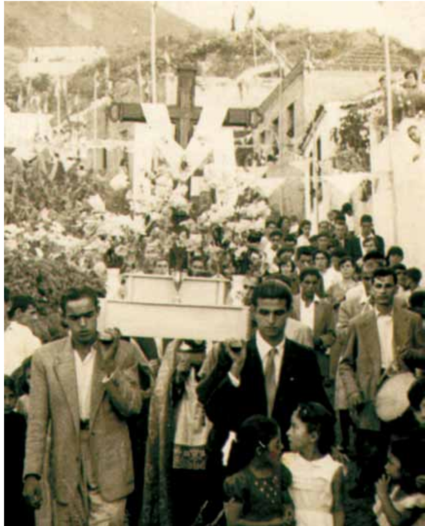
Cruz de La Higuera

Limítrofe con la vecina ciudad del Puerto de la Cruz y a los pies de la Montaña de los Frailes, nos encontramos con este núcleo poblacional de La Higuera. Allí, durante el primer fin de semana de julio, se celebra la fiesta a la Santa Cruz. Las celebraciones religiosas y la procesión que recorre las calles de la zona dejan paso a una comida de convivencia vecinal, festivales de variedades musicales, de