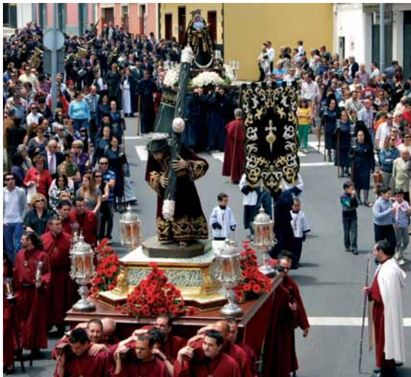
Procesión del Calvario. Parroquia del Apóstol Santiago

La Semana Santa de Los Realejos es un cúmulo de tradiciones fraguadas en la fe y manifestada cada año en cultos y celebraciones heredadas de siglos y que se combinan con las recientemente creadas, en una fusión que se caracteriza por una singularidad propia, marcada por la orografía del municipio y la multiplicación de parroquias que se van instaurando en cada núcleo. Aquella Semana Santa de los siglos pasados, localizadas en las parroquias matrices del Apóstol Santiago y Nuestra Señora de la Concepción, se ha ido diversificando con la creación de las nuevas entidades parroquiales de Nuestra Señora del Buen Viaje en Icod el Alto, Nuestra Señora de los Dolores en Palo Blanco, Nuestra Señora de las Nieves en La Zamora, San Cayetano en La Montañeta, Nuestra Señora del Carmen en San Agustín y Nuestra Señora de Guadalupe en el Toscal Longuera. En todas ellas tienen lugar celebraciones y cultos durante estos días.