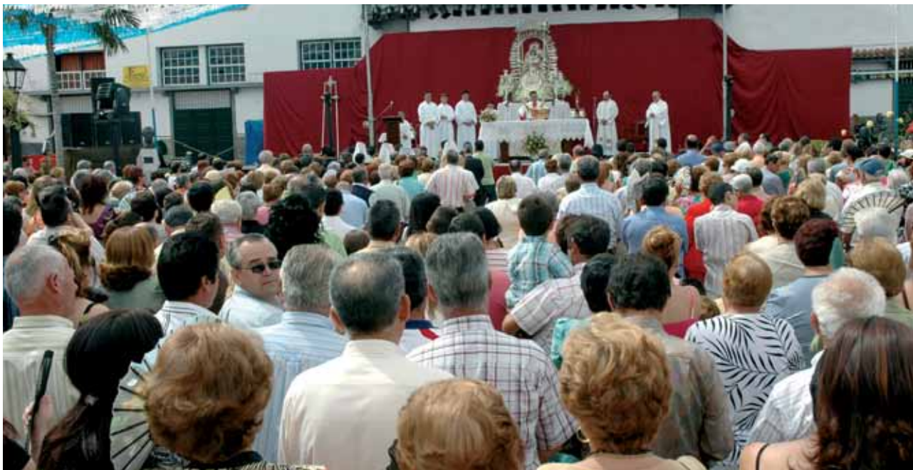
Jornadas de Reinserción Social. Fiestas de Las Mercedes. La Cruz Santa