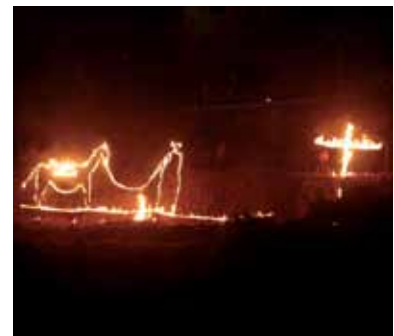
Quema de «mechones» en El Lance

La orografía del propio término motivó a sus vecinos a dividirse por cuarteles, sistema de fracción poblacional. La tradición perdura en estas fiestas, donde la participación masiva de sus habitantes se patentiza en cada uno de los actos programados, como festivales, galas y bailes, donde se congregan miles de personas. Los días más importante del