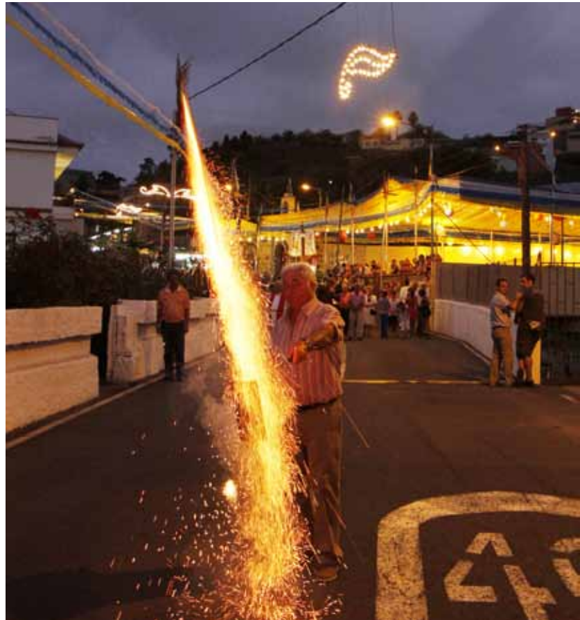
Las fiestas mantienen tradiciones celosamente guardadas durante siglos

Estas fiestas, que mayoritariamente arrastran tradiciones celosamente guardadas durante siglos, unidas al carácter amable de sus gentes, constituyen un signo indudable de la nobleza de un pueblo que siempre está abierto al abrazo de sus miles de visitantes.