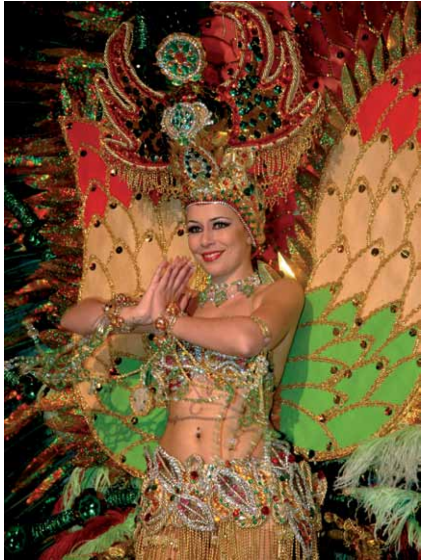
Reinas, murgas, comparsas y fanfarrias dan color al Carnaval realejero

La llegada de las carnestolendas no pasa ajena para los realejeros, desde antiguo se celebran estos festejos en la localidad, aunque de una manera significativa desde los años ochenta del pasado siglo, cuando se estructuran las fiestas de Carnaval como hoy las podemos disfrutar, promovidas, por aquel entonces, por el pujante Centro de Iniciativas y Turismo de la localidad. La eclosión carnavalera de la capital de la isla, junto con otras ciudades como Puerto de la Cruz, fue el acicate para el despegue carnavalero en los pueblos como Los Realejos, donde se comenzaron a organizar murgas, comparsas, shows, surgiendo la consecuente gala de elección de la reina, cabalgatas y cosos, para terminar con el entierro del Sr. Rascayú, personaje que encarna los festejos. La configuración actual de los carnavales realejeros varía según los años y la organización de los mismos, que corre a cargo de la concejalía de fiestas del ayuntamiento. Desde el fin de semana antes del domingo de Carnaval tienen lu-