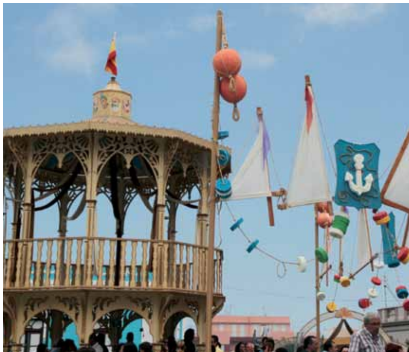
El Tabladillo. Fiestas del Carmen. San Agustín

El domingo de la Octava o de los marinos, como popularmente se le conoce, es el punto álgido de los festejos, y ello supone esa esperada fecha dentro de las celebraciones. Hasta la zona de San Agustín acuden miles de visitantes que quieren disfrutar de esa tarde de julio, donde la Virgen del Carmen es portada a hombros por los pescadores y marineros de la vecina ciudad del Puerto de la Cruz, fundamentada en una tradición que supera los dos siglos y medio. Gritos, alabanzas, piropos, cantos y plegarias, son la tónica del recorrido procesional, mien-