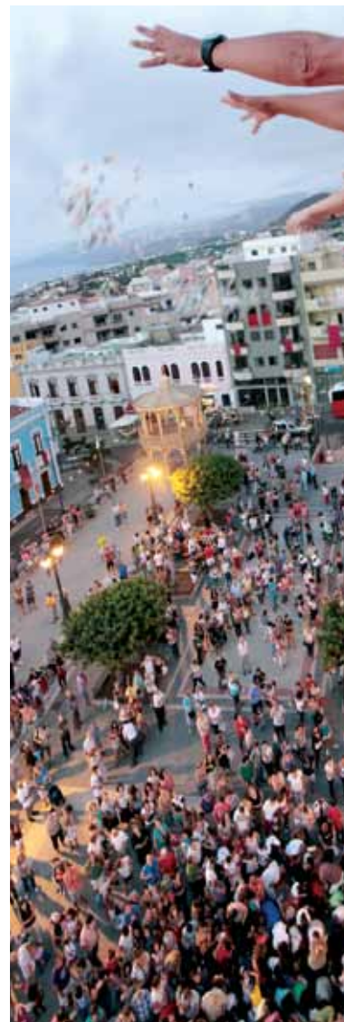
Lluvia de Caramelos. San Agustín

En el núcleo de su nombre, cada 28 de agosto se celebra la fiesta dedicada a su patrón, San Agustín. Los festejos, que se limitan tan sólo a ese día, tienen dos partes, una dedicada a los niños y otra religiosa. Sortijas de bicicletas dan paso a grandes lluvias de caramelos, confetis, globos y aleluyas desde la torre de la iglesia de Nuestra Señora del Carmen, en recuerdo de la tradición conventual del pasado. Para terminar la jornada, tiene lugar la santa misa y la procesión.