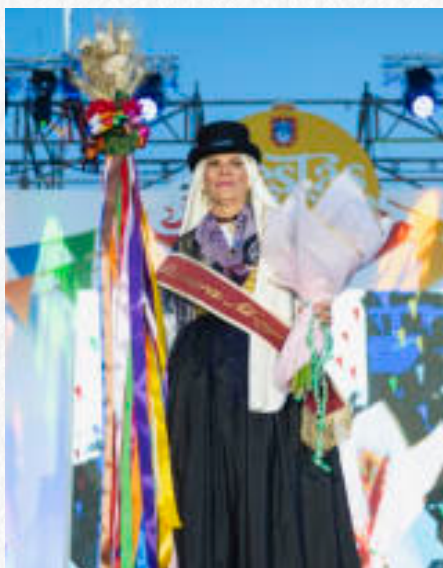
NELLY CARMEN GARCÍA MENDOZA ROMERA MAYOR 2025