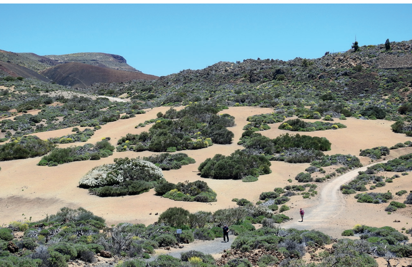
La ruta SPN2 comparte inicio con la SPN4 en la pista de Siete Cañadas.

Las panorámicas desde el punto más elevado de la ruta, en la Montaña del Cerillar, y el contraste cromático de los conos de picón de Arenas Negras.